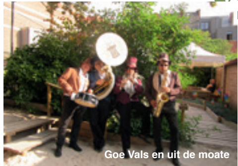
Goe Vals en uit de moate